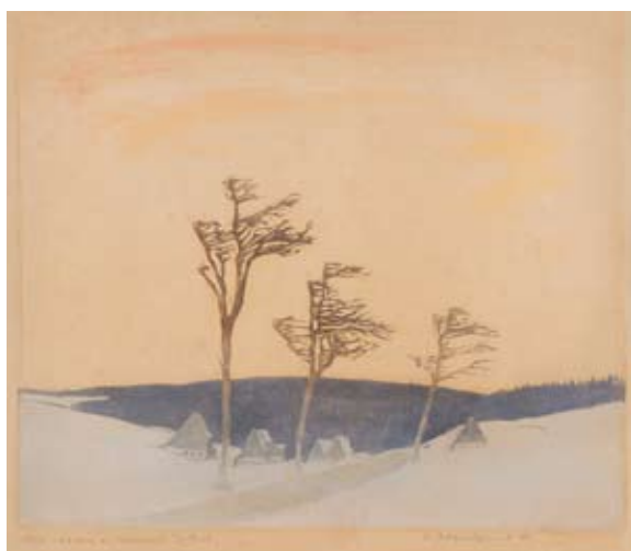
Erich Buchwald-Zinnwald (1884 – 1972) Silnice do Geisingu v zimním večeru 1939, barevný dřevorez, 29 x 39 cm