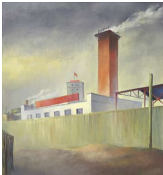
Kurt Teubner (1903 – 1990) Důl DSF nedatováno, olej na dřevovláknité desce, 75 x 70 cm