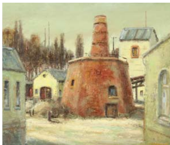
Rolf Schubert (1932 – 2013) Stará vápenice v Krušných horách 1991, olej na dřevovláknité desce, 50 x 60 cm