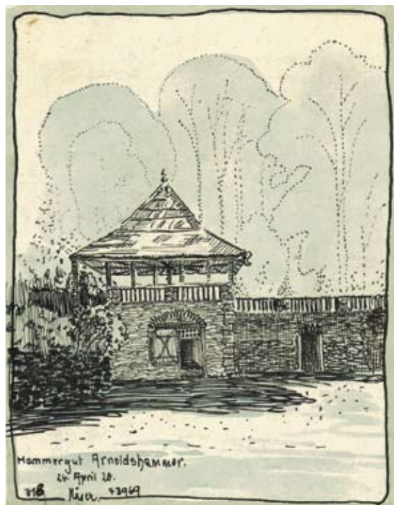
Friedrich Näser (1903 – 1998) Usedlost Arnoldshammer 1920, perokresba tuší, lavírováno, 11 x 8,5 cm