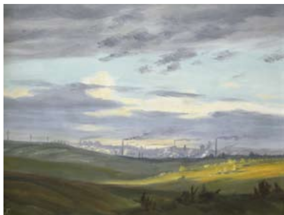
Paul Hugo Türke (1905 – 1982) Hornická krajina – Oelsnitz nedatováno, olej na dřevoláknité desce, 36 x 47 cm