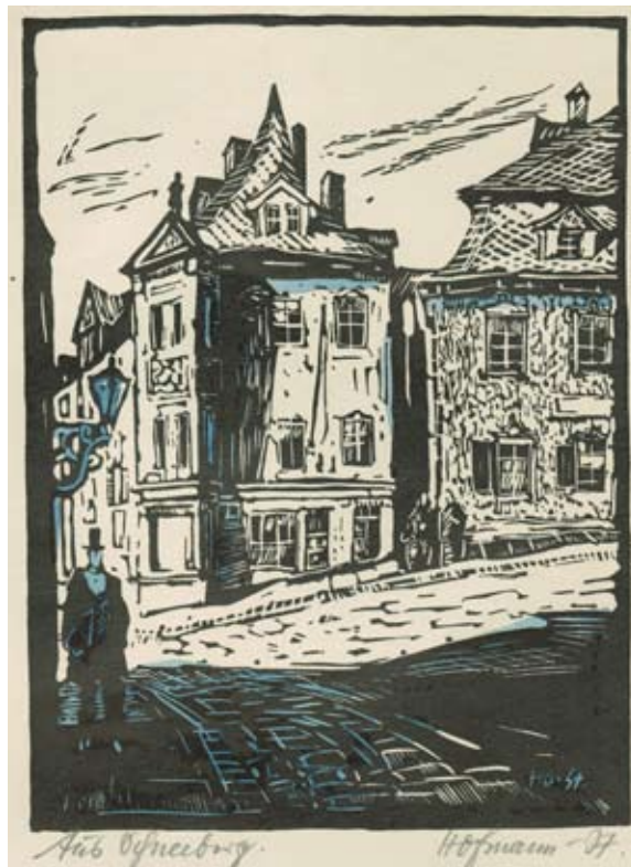
Alfred Hofmann-Stollberg (1882 – 1962) Z obce Schneeberg (ze souboru: Krušnohorská krajina) nedatováno, dřevorez, akvarelováno, 19,5 x 13,5 cm