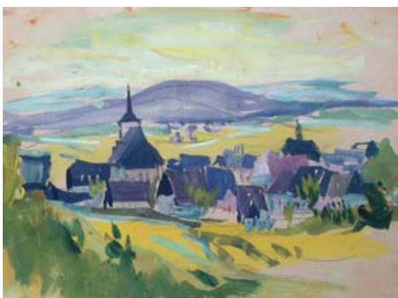
Alfred Hofmann-Stollberg (1882 – 1962) Gottesgab/Boží Dar, nedatováno, tempera, 24 x 34 cm