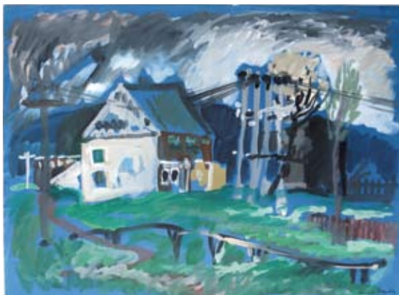
Carl-Heinz Westenburger (1924 – 2008) Měděnec – Kupferberg, česká krajina na hřebenu 1989, akvarel, 50 x 65 cm