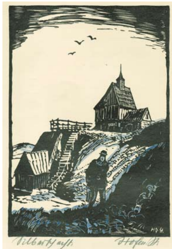
Alfred Hofmann-Stollberg (1882 – 1962) Stříbrný důl (ze souboru: Krušnohorská krajina) nedatováno, dřevorez, akvarelováno, 19,5 x 13,5 cm

Výstava otevírá mimořádný pohled na jedinečnou hornickou kulturní krajinu Krušnohoří. Nabízí četné umělecké a historické pohledy na místa hornického regionu Erzgebirge/Krušnohoří, který byl v červenci roku 2019 zapsán na seznam světového dědictví UNESCO.